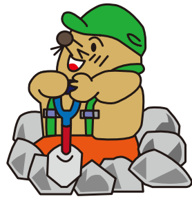
地中熱のモグたん