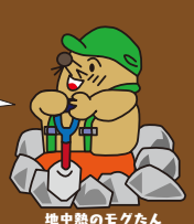
地中熱のモグたん